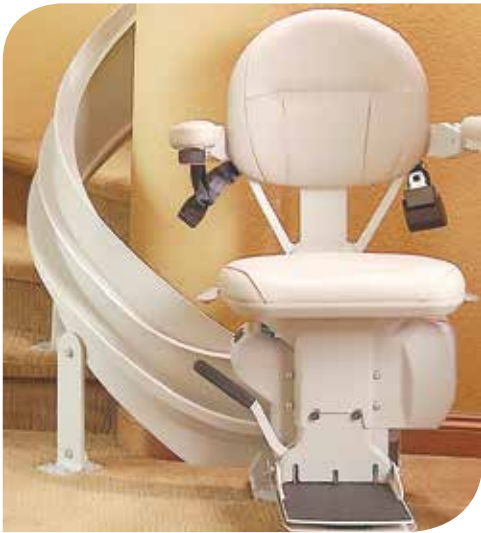
Confort y estilo de lujo.

Vinilo con color convencional tostado y cinco opciones de tapicería. O proporcione su propia tapicería y Bruno tapizará la silla de manera personalizada para usted.