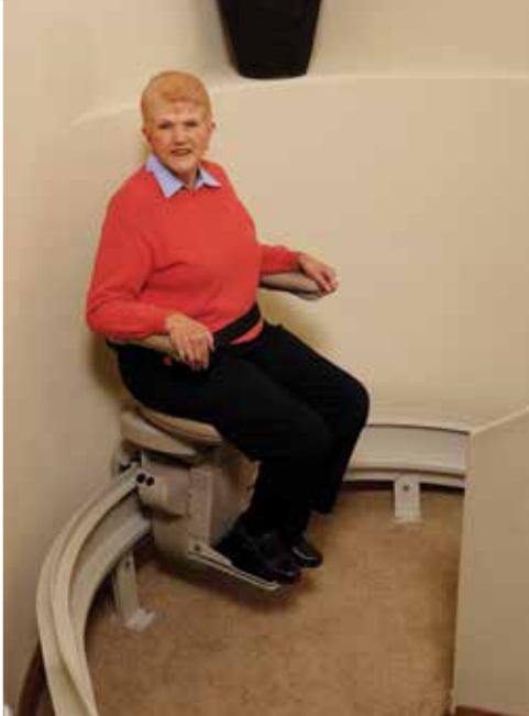
Hecho a la medida para que ajuste de manera precisa en las curvas.